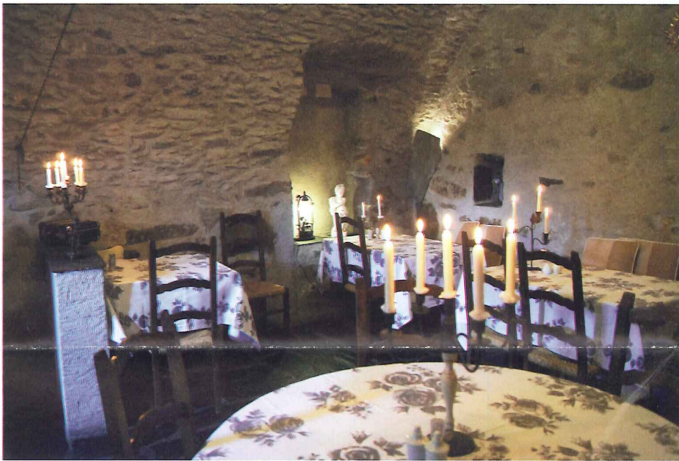
im urchigen Grotto