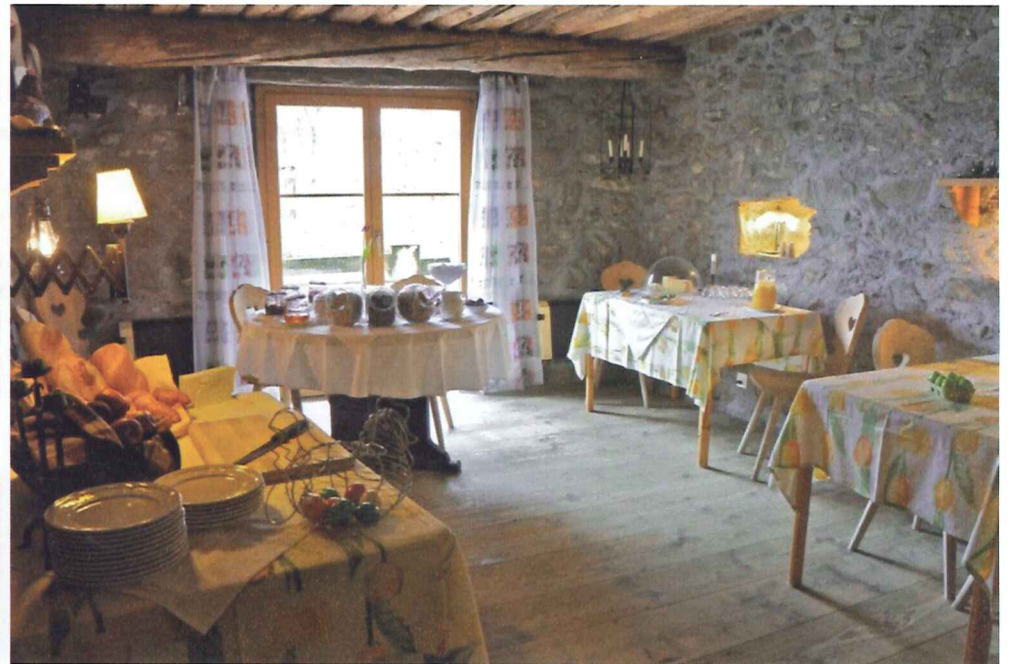
im über 300-jährigen Stalla