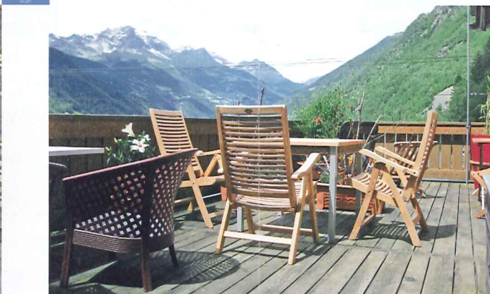
Terrasse für unsere Hotelgäste