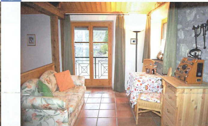
Suite du Président