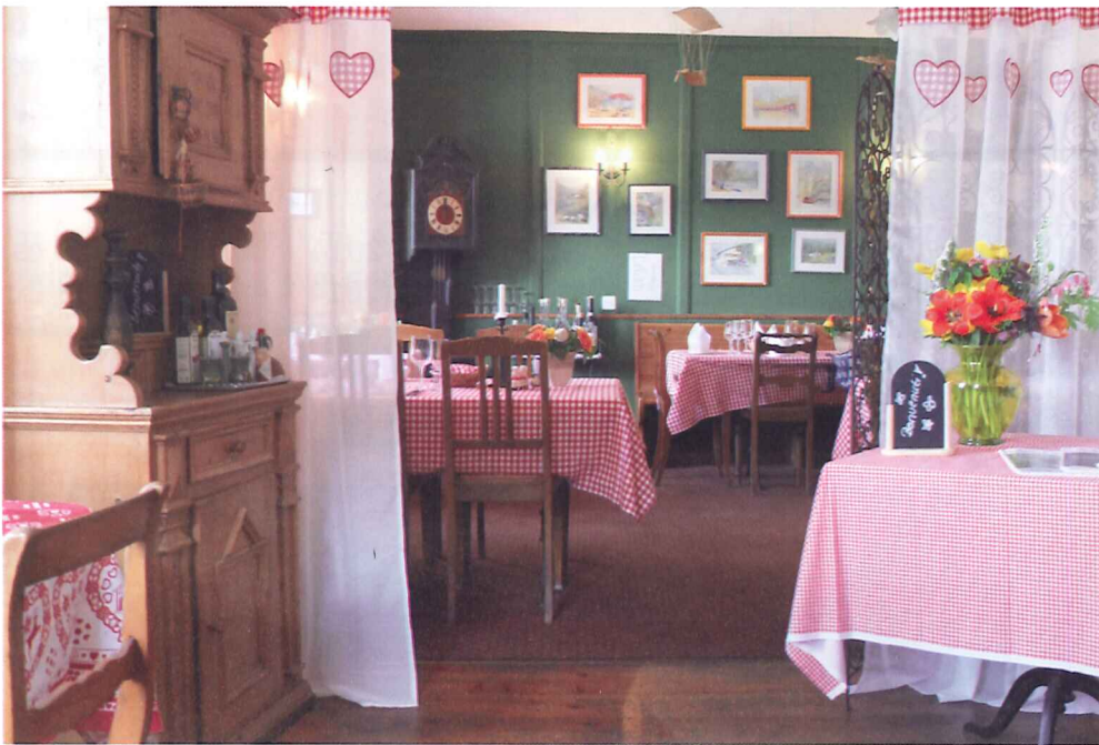
im originellen Ristorante