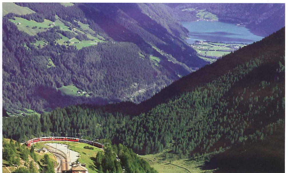
Alp Grüm mit Lago di Poschiavo