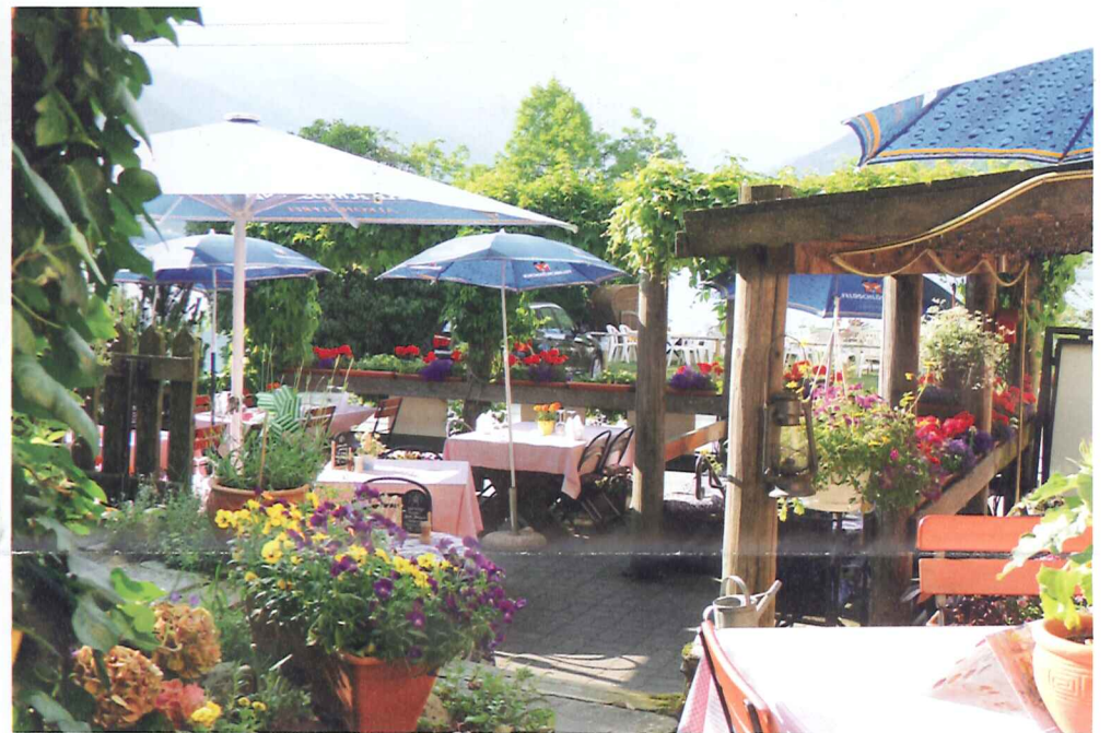
oder auf unserer Terrasse